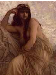
E. Hébert. Roma Sdegnata. Huile sur bois